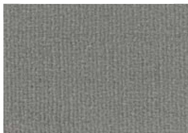
0015 Middle Grey