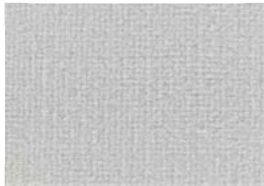
0005 Light Grey