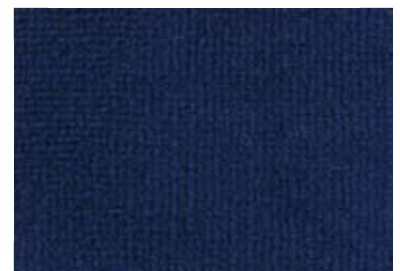
0014 Navy Blue