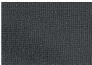
0025 Dark Grey